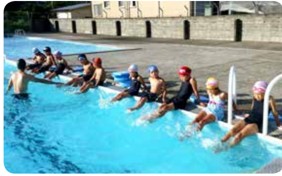
水泳の授業を受ける小学生