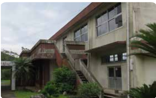
建て替え予定の龍南中学校体育館

体育館は雨漏れ箇所の補修工事を行っています。いまだに解消されていない状況で授業や部活動に不便をきたし、皆様にご迷惑をかけております。平成29年度に耐力度調査・基本設計・実施設計・解体工事を計画し、平成30年度に建設予定を進めていきたいと考えているところです。