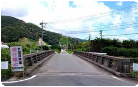
龍郷自動車学校前の橋梁

平成26年度から橋梁詳細点検を、5年に一度実施することを道路管理者に義務付けられ、老朽化対策に取り組んでおります。速やかに補修などを行う必要があります。今後も計画的に実施していきます。