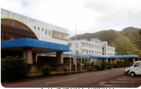
奄美看護福祉専門学校

奄美本島唯一の国家資格免許が習得できる高等専門学校です。奄美市では、平成27年度からいろいろな面で支援がされています。本町の福祉専門学校生徒への支援は。