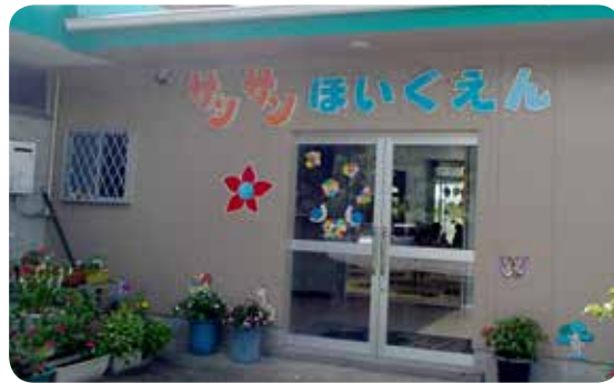
新規に開園したサンサン保育園

平成27年度4月から、子ども・子育て支援制度がスタートし、市町村による認可事業(地域型小規模保育)として、本町でサンサン保育園が新規に開園しているところです。