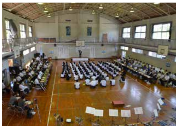
龍南中学校で行われた結成式