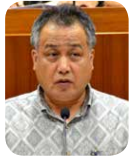
徳永 義郎 議員