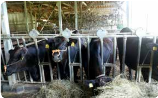
ブランド化が進む奄美牛