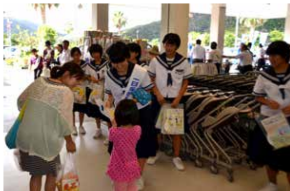
街頭キャンペーンの様子