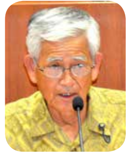
岩崎 晴海 議員