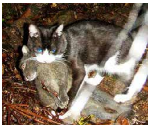
クロウサギを捕食するノネコ

奄美大島の森林内には、野生化したイエネコ(ノネコ)が生息しアマミノクロウサギなどの希少動物を捕食していることが研究者の