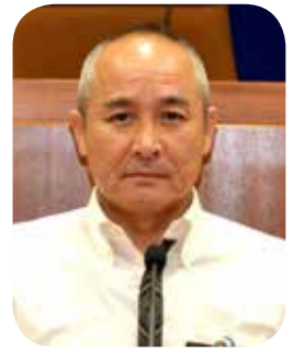
平岡 馨 議員