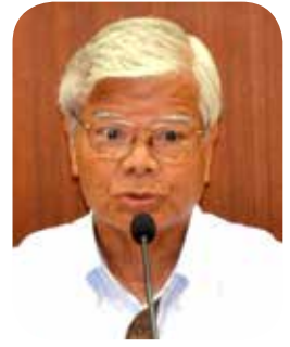
碓山 幾郎 議員