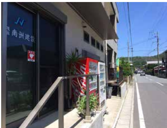
AEDが設置された南洲建設(有)の事務所