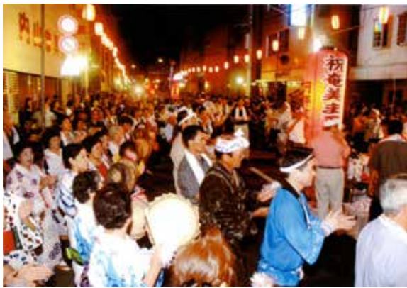
奄美まつり八月踊りへ参加の様子

全国各地で活躍されている「龍郷町」の出身者。このページでは、郷里の心を胸に活動する郷友会を紹介いたします。