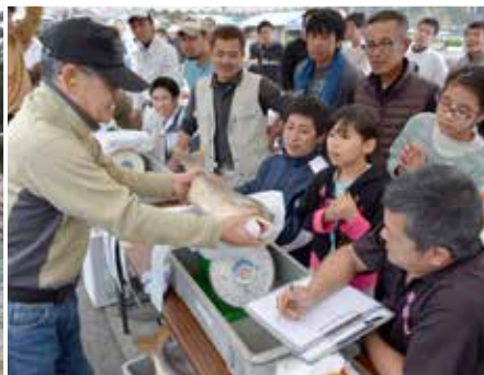
玉里漁港であった検量