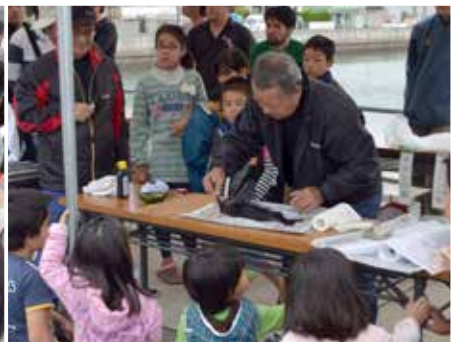
魚拓の実演もありました