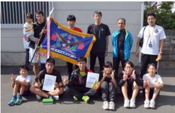
Bクラスを制した円