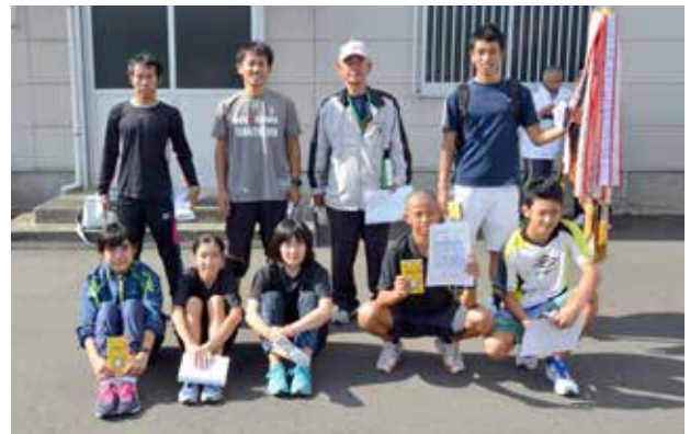
Aクラス優勝の大勝A