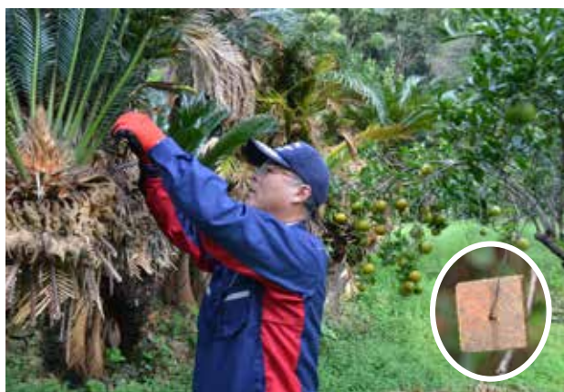
町内でもテックス板を設置しました