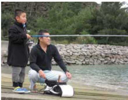
親子で糸を垂らす光景も