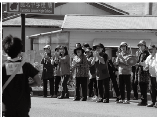
沿道ではチヂンを持った 応援団も駆けつけました