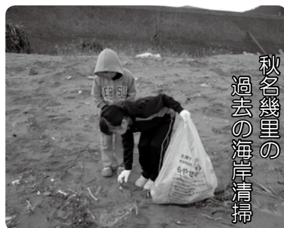
秋名幾里の過去の海岸清掃