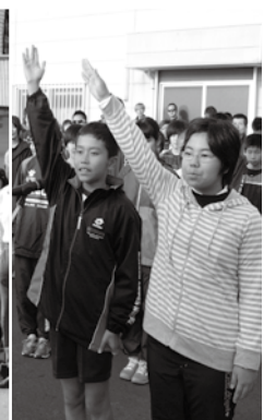
秋名校区による 選手宣誓