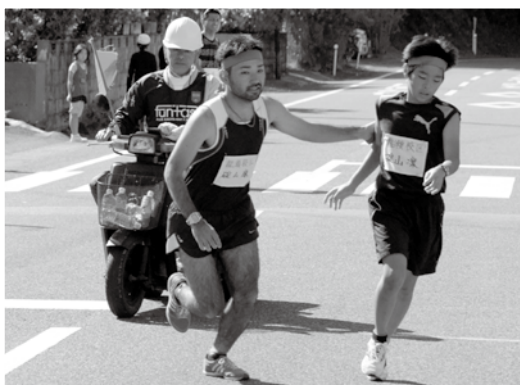
父が見守る中、 弟から兄へタスキが繋がりました