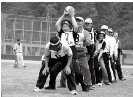
活気にあふれた町大会(上)と北大島地区大会(下)