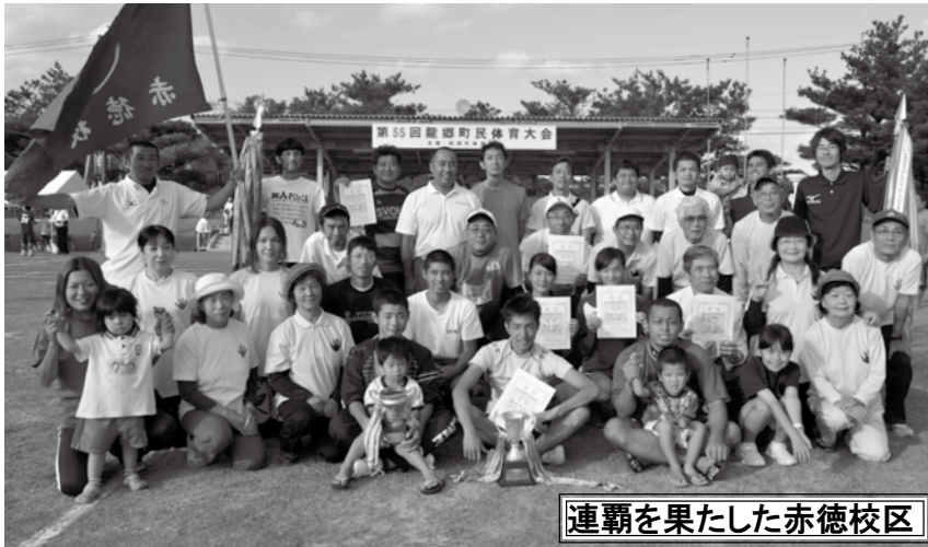
連覇を果たした赤徳校区