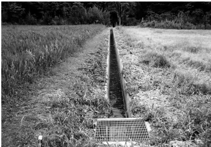
その後、瀬留地区農地の排水溝は整備されました