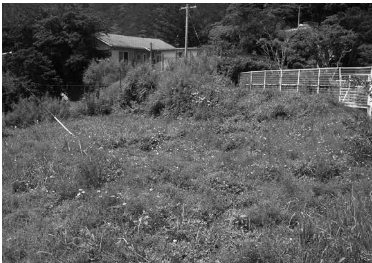
老朽化が進む龍南中学校体育館(上)と武道館(中)。グラウンド横にある空き地(下)