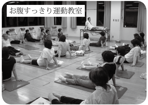
お腹すっきり運動教室

を地域で支え、安心して暮らすことができるよう見守り隊の組織づくりを各集落で行い、安全・安心なまちづくりを進めて参ります。