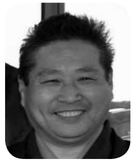
伊勢 勝義 議員