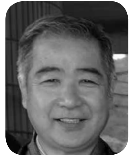
前田 豊成 議員