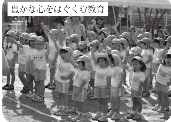
豊かな心をはぐくむ教育

今後とも、ここに申し上げました安全・安心で活力あるまちを目指す施策を推進し、私たちのまち「たつごう」を魅力あるまちに創り上げて参りたいと思っておりますので、町民の皆様には、引き続き特段のご理解とご協力を心からお願い申し上げます。平成26年度の施政方針とさせていただきます。