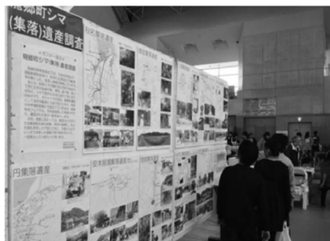
▲町民フェアでの展示光景