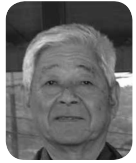
窪田 圭喜 議員