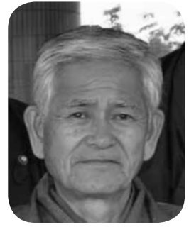
岩崎 晴海 議員