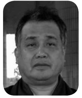
徳永 義郎 議員