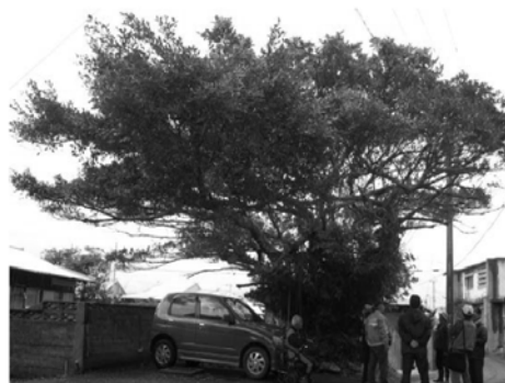
▲広場にそびえるガジュマルを観察（円）

【問い合わせ】 龍郷町教育委員会 文化財担当 （直通）0997-69-4532 （内線172）