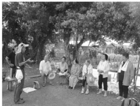
▲聞き取り調査の様子（下戸口）