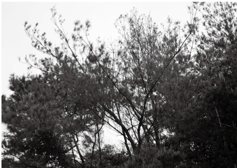
町内でも見られる枯れた松の木(中央)

答 松枯れ対策については、大島支庁や九州電力、NTTなどと協議しており、町道管理については、伐採が必要などころを把握しながら進めてまいります。