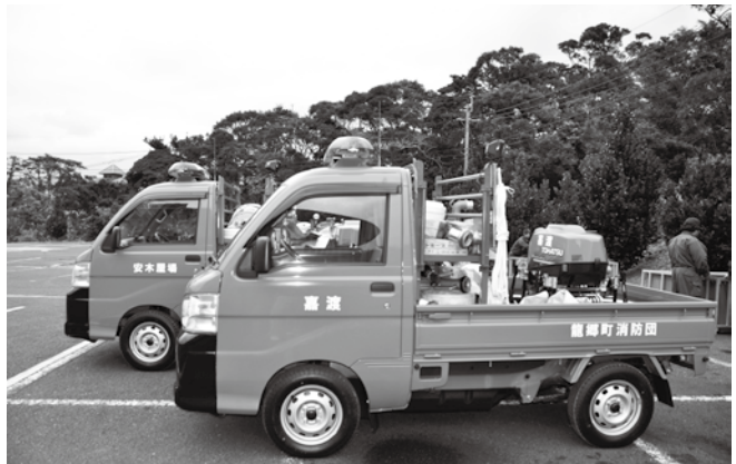
安木屋場班と嘉渡班に新たに 整備された小型ポンプと積載車