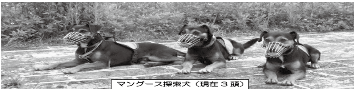
マングース探索犬（現在3頭）

・マングース探索犬（写真：マングースのフンや巣穴などを確認するための犬）を伴った作業は、作業道から外れて行うこともあります。矢先の確認を徹底していただきますよう、よろしくお願い致します。