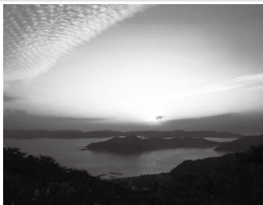
長雲峠からの元旦初日の出

何よりも皆さんにとつては 健康で安心なよりよい年に なりますように。まずは、長 雲の森から新年のご挨拶とし たいと思います。