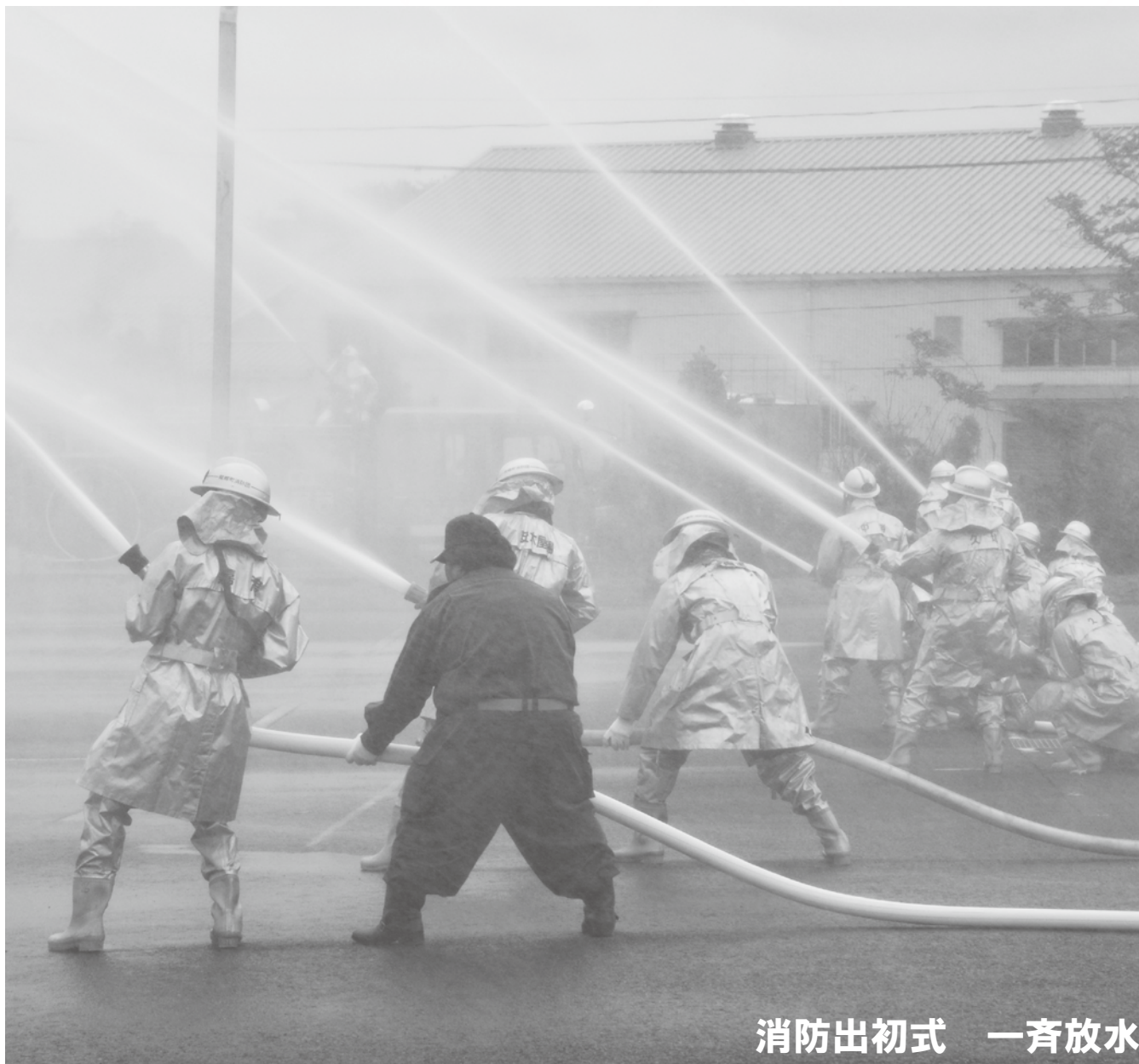
消防出初式 一斉放水