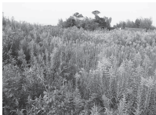
セイタカアワダチソウ