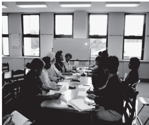
家族会の様子です。自己紹介をしています。