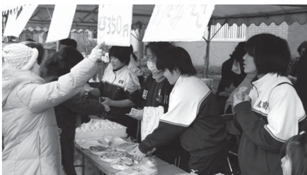
龍南中学校バレー部によるバザー