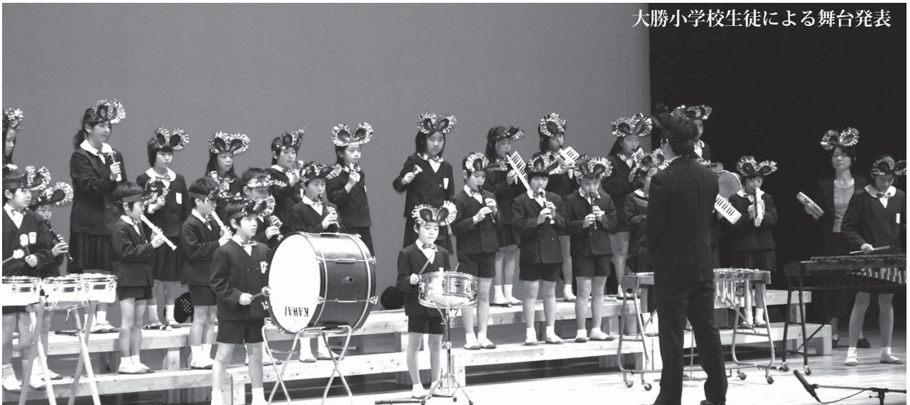
大勝小学校生徒による舞台発表