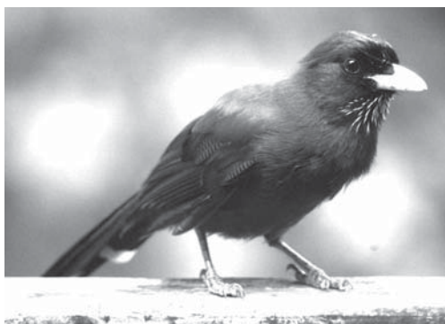
ルリカケス（白黒でごめんなさい）

いくつになっても完了ではなく一生涯が新しいことの勉強になる。どうやれば、あと数年で世界に肩を並べるくらいになって、そして静かな集落の雰囲気や文化が維持できるか、または農水産業や製造業も観光業に負けないくらい盛り上げることができるのか、これから皆で一緒に考えてみましょう。それにはルリカケスやクロウサギ達が手伝ってくれることになるでしょう。