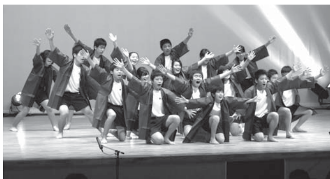
龍北中生徒による「龍北ソーラン節」

2月19日、恒例の龍郷町民フェアが開催されました。冷たい北風が吹く寒い日でしたが、会場となった「りゅうゆう館」には大勢の人出で賑わいました。