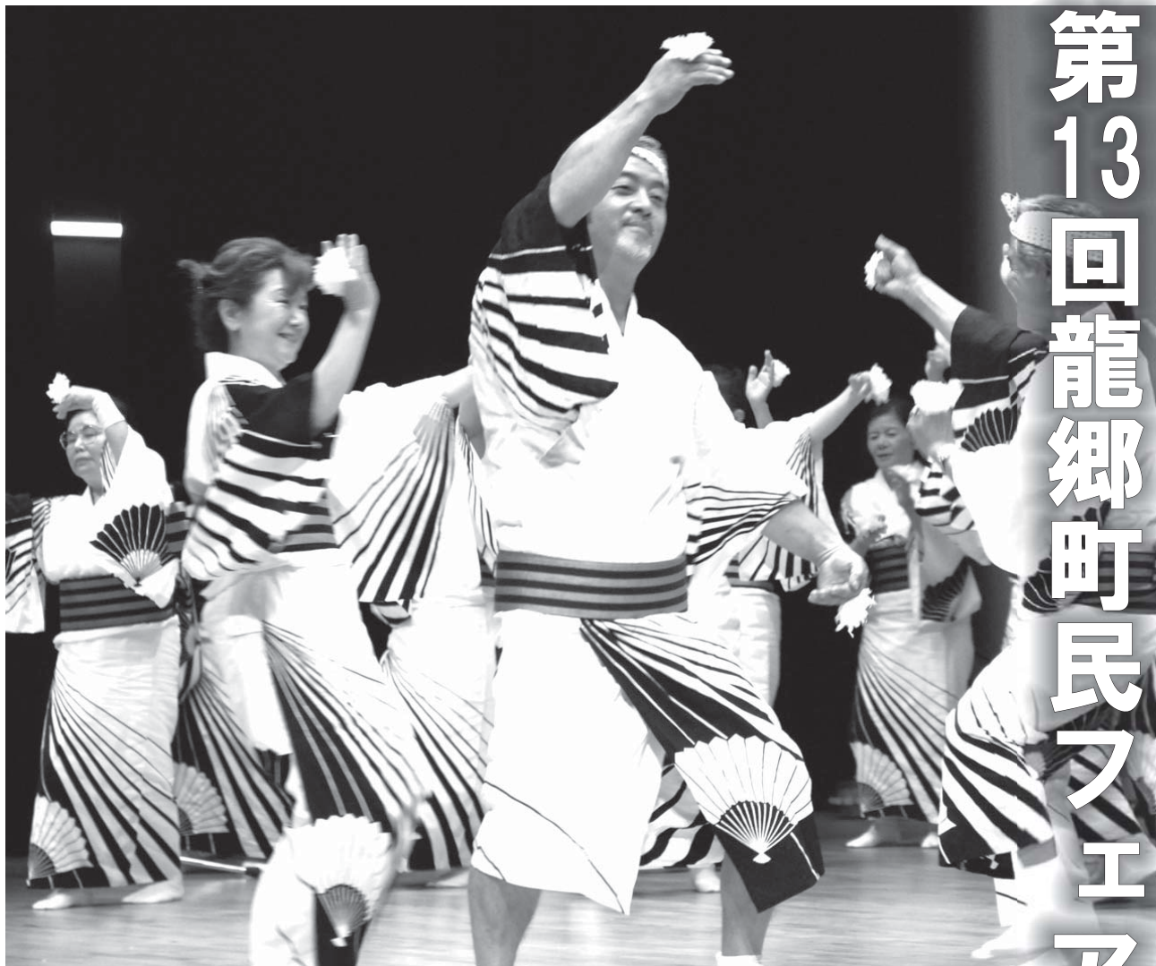
赤尾木集落による八月踊り